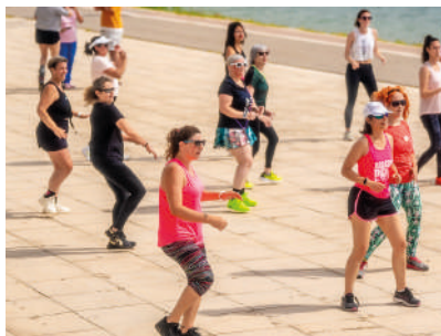
10:00h > 16:00h ACTIVITATS SOLIDÀRIES AL TERRA