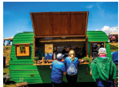
10:00 > 16:00 FOODTRUCKS, ESPECTACLES CULTURALS PARADETES I MÚSICA

QUÈ ESTÀS ESPERANT? VISITA LA NOSTRA PÀGINA WEB I REGISTRA'T!