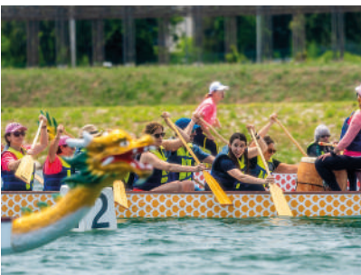
10:00h > 16:00h JORNADA SOLIDÀRIA D'INICIACIONS AL DRAGON BOAT